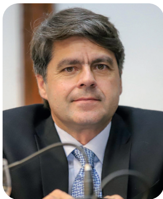
Deputado Paulo Câmara (PSDB)

Ao justificar a medida, ele explicou que a dislexia é uma condição neurológica que afeta a leitura, a escrita e a soletração, atingindo entre 5% e 17% da população brasileira. Entre as diretrizes sugeridas estão a formação específica de professores, a oferta de recursos pedagógicos acessíveis — como softwares de leitura e livros digitais — e o apoio psicopedagógico e psicológico contínuo aos estudantes diag-